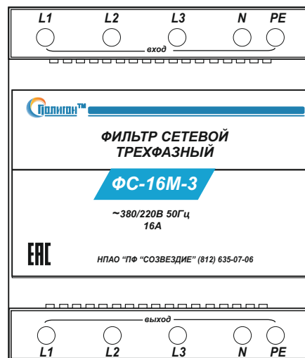
Рис.1. Порядок подключения фильтра ФС-16-3.